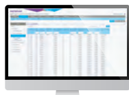
業界に先駆けてWeb GUIで直感的に設定できるスマートスイッチを発売。